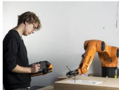
Numerical machines workshop