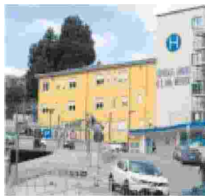
INUTILE Il ricovero della donna nell'ospedale di Lanusei

nio Cascio, infettivologo, professore di Malattie infettive all'Università di Palermo - Se è vero che la signora in Sardegna è morta a causa di rickettsiosi, allora non esiste vaccinazione. Tuttavia sarebbe utile mettere ai nostri animali domestici il collare acaricida che può tenere lontane le zecche. Inoltre, se sappiamo di essere stati in campagna o in mezzo alla natura, alla sera è bene ispezionare il corpo e verificare la presenza di escrescenze che possono assomigliare a dei nei. Purtroppo le zecche non vanno via con l'acqua della doccia ma restano attaccate. In genere l'infezione portata dalla zecca è considerata