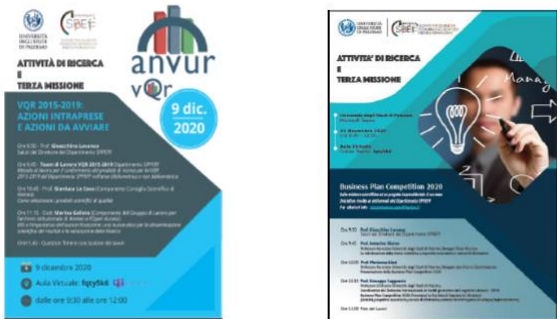
Fig. 1A e 1B Locandine Meeting di Dipartimento Ricerca e Terza Missione anno 2020