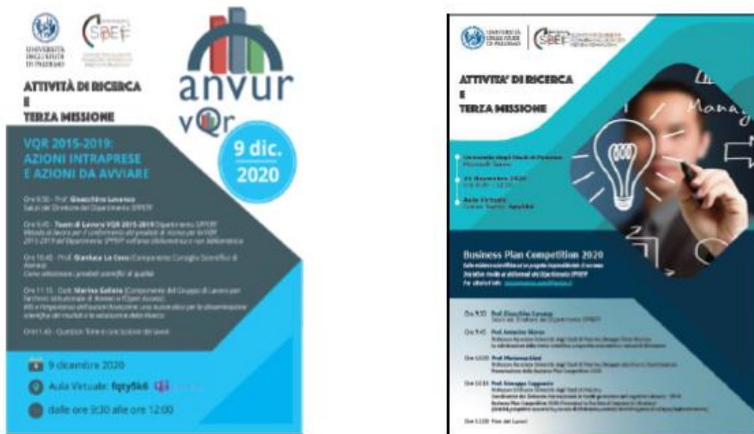
Fig. 1A e 1B Locandine Meeting di Dipartimento Ricerca e Terza Missione anno 2020